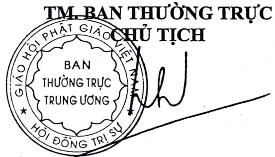
Hòa Thượng Thích Thiện Nhơn